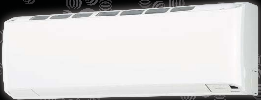
Sanyo 96/126 »

Sanyo, en av världens största tillverkare av klimat- och hemelektronik, har under många år försett den svenska marknaden med helt problemfria värmepumpsanläggningar.